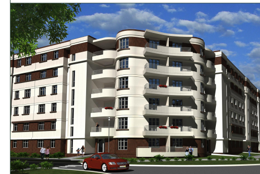
ZESPÓŁ BUDYNKÓW MIESZKALNYCH WIELORODZINNYCH Z GARAŻAMI